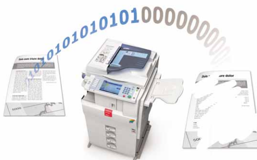
Dataöverskrivning på hårddisken

MP C2050/MP C2550 är kompatibla med tillvalslösningar som dataöverskrivning på hårddisken, säkerhetsenhet för kopieringsdata, kortautentisering och säker utskrift.