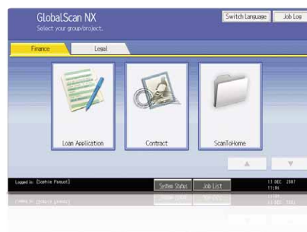
Lättanvänt grafiskt användargränssnitt