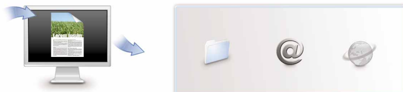
Skanna till e-post, mapp och URL med bara en knapptryckning